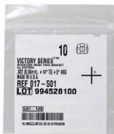
3M Victory Series Miniature Mesh Twin Bracket UL Centr. .022 3M