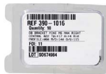
AO Mini MS Klebebracket OK Zentral rechts American Orthodontics