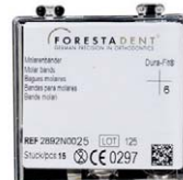
Forestadent Molarenbänder Dura-Fit Forestadent