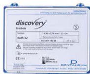
Discovery Brackets System Roth 22 Dentaurum