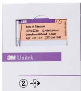
3M Beta III Titanium Ortho Form III-Ovoid Lower 3M