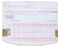
Forestadent Aesthetik-Line Brackets Standard-Edgewise .018 Forestadent