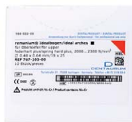
Remanium Idealbogen für Oberkiefer federhart plus Dentaurum