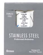
Stainless Steel Arch Blank Upper .019 x .025 Ormco