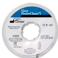
Grey Power Chain I 15 ft. Roll Ormco