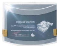
BioQuick Brackets Mc Laughlin/Bennett/Trevisi System Slot 18 Forestadent