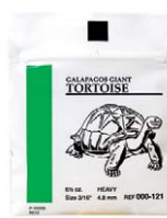
AO Elastics Galapagos Giant Tortoise, Heavy, Latex American Orthodontics