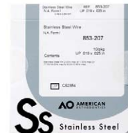
AO Natural-Bogen Form OK vierkant, .019 x .025 Form 1 American Orthodontics