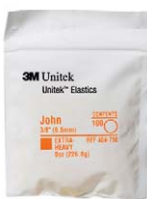
3M Unitek Elastics John 3/8" extra-heavy, Latex 3M