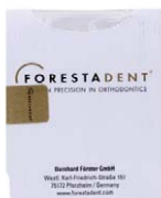
Forestadent Stahlbögen OK Maxillary .019" x .025" Forestadent