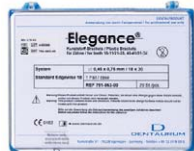
Elegance Kunststoff-Brackets Standard Edgewise 18 Dentaurum